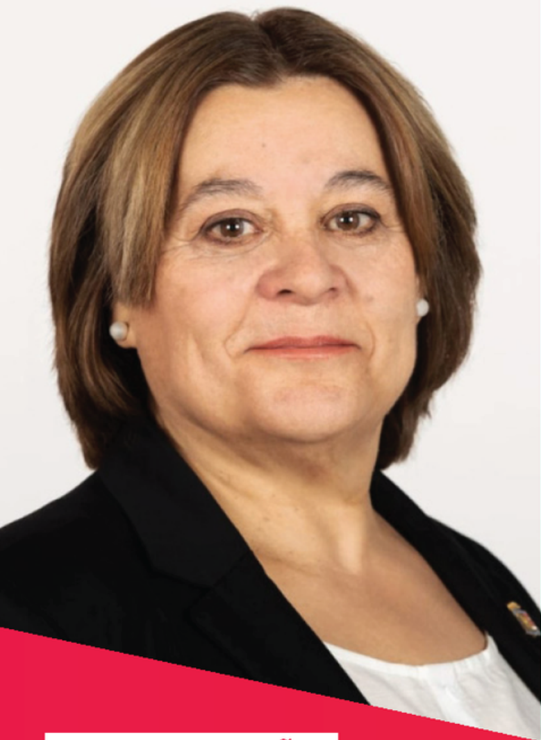
PALOMA MAROÑAS CANDIDATA A LA ALCALDÍA DE COLMENAR VIEJO