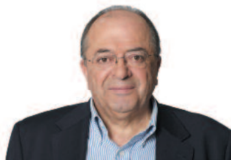
Fernando del Valle del Álamo Candidato del PSOE a la Alcaldía de Colmenar Viejo

Colmenar Viejo ya se merece otro gobierno, y para realizar con garantía el cambio necesario, solicitamos tu apoyo.