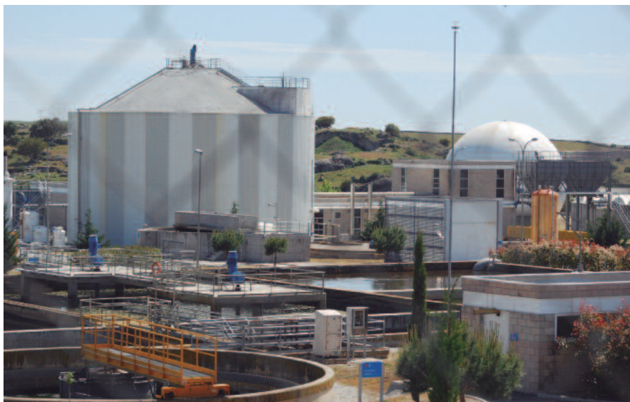
Depuradora de Aguas de Navarrosillos.

Estudiaremos con los colectivos afectados la posibilidad de utilizar para actividades agropecuarias los 7.000 metros cúbicos de agua reciclada que diariamente se arrojan al río.